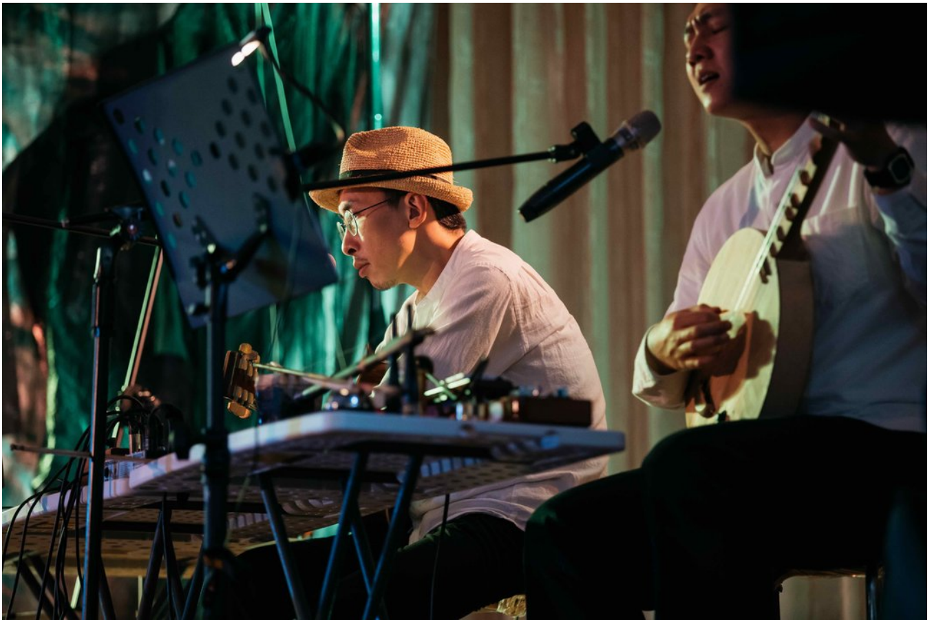
《明白歌》2022年在台中丰原的演出.