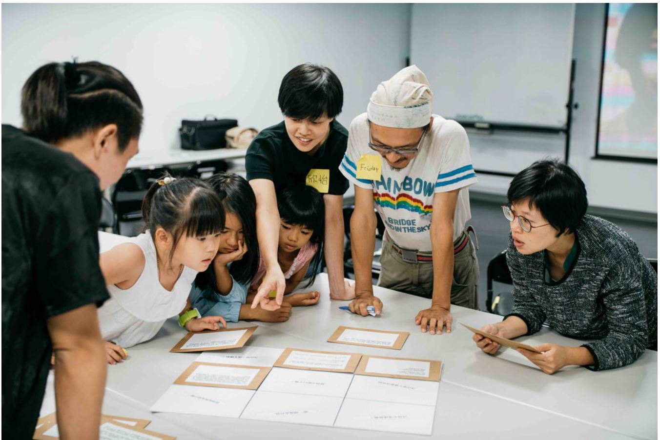
《明白歌》2019年于苗栗竹南跟随演出举办的亲子工作坊.

如果《明白歌》一作的边界，不只由舞台、灯光、声音、表演、场面调度所框定，而是必须扩及上述行动，以及与地方乡亲、家属、受难人的沟通；同时包括且不限于：为了筹募资金所以与亲蓝亲绿各地方派系沟通白色恐怖、为了为高度政治敏感的议题找到合适的演出场地而必须游说甚至掷筊请示神意、为了面对知与不知之间的鸿沟而必须以行动绘制白色恐怖在各乡镇的地图呢？流言、口语、争执、和解等话语似乎就必须一并被纳入更宏观的“声音剧场”。