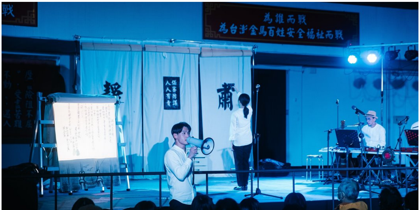
《明白歌》2022年在台北空总中正堂的演出。

演出当天金瓜石大雨大雾，观众席右侧成排红灯笼的其中一盏，不晓得是否因为水气造成短路，像所有电影预告坏事即将发生的典型手法那样噼啪明灭。密集打在劝济堂屋瓦、庙埕的雨滴如同成千上万个巴掌赏在耳膜，老实说难以确认是否真的接收到了